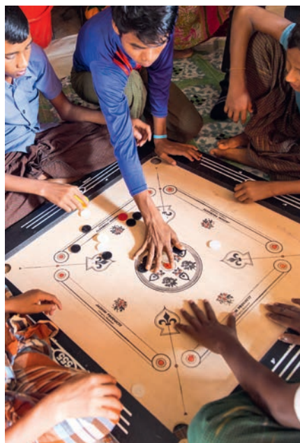
RECHTS: Die Jungs bei einem Brettspiel. Sie möchten endlich zur Schule und hoffen auf die Erlaubnis der Regierung von Bangladesch.