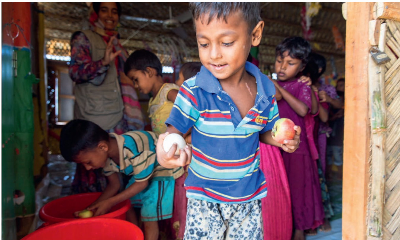
Ein Apfel und ein Ei für den jungen Mann. Der Vorrat im Kinderzelt des Flüchtlingslagers Kutupalong reicht auch noch für die weiteren Kinder, die anstehen.