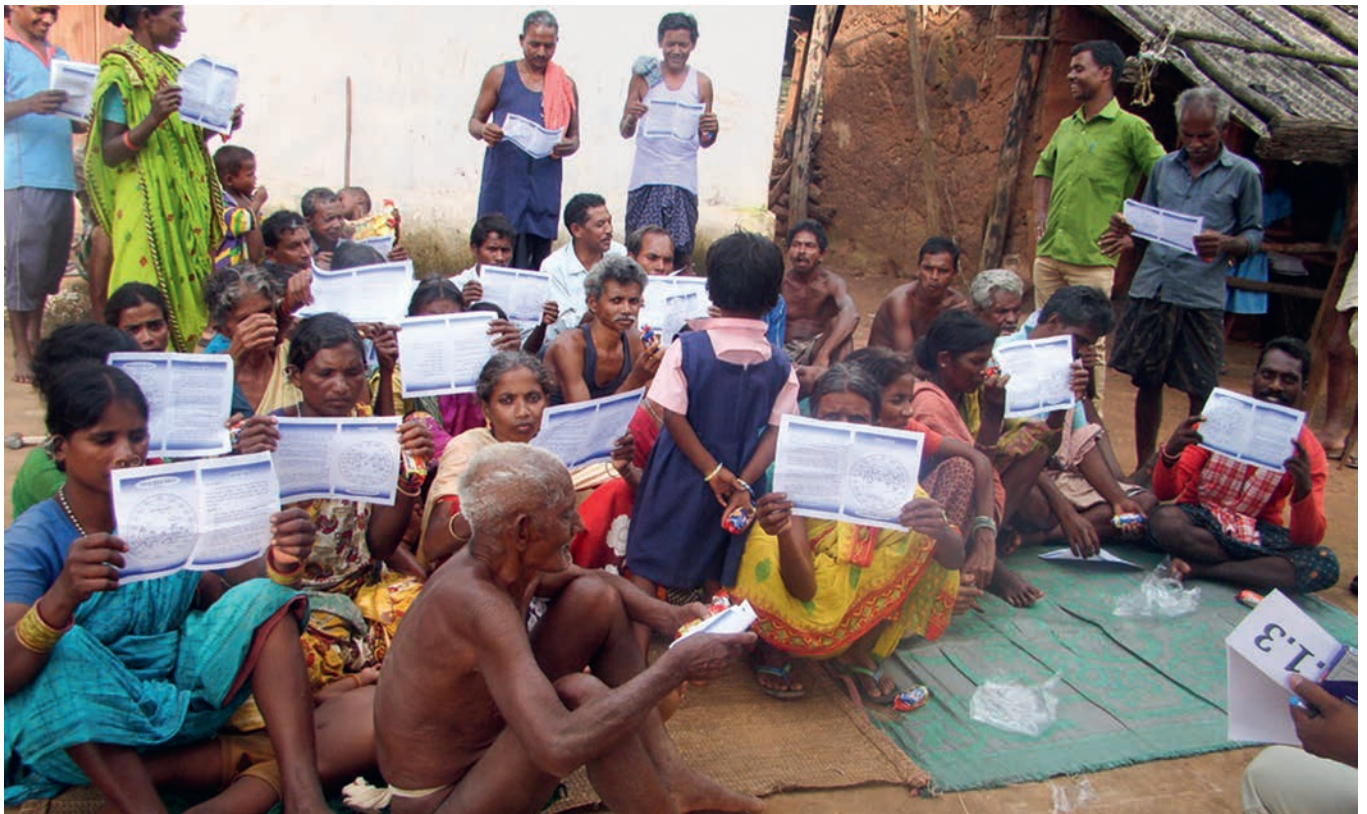
Auf der Seite der Benachteiligten: Dalit einer Dorfgemeinschaft lernen ihre Rechte als indische Staatsangehörige kennen. Das jesuitische Netzwerk Lok Manch ist in 13 Bundesstaaten aktiv und steht im Dienst von marginalisierten Gemeinschaften.