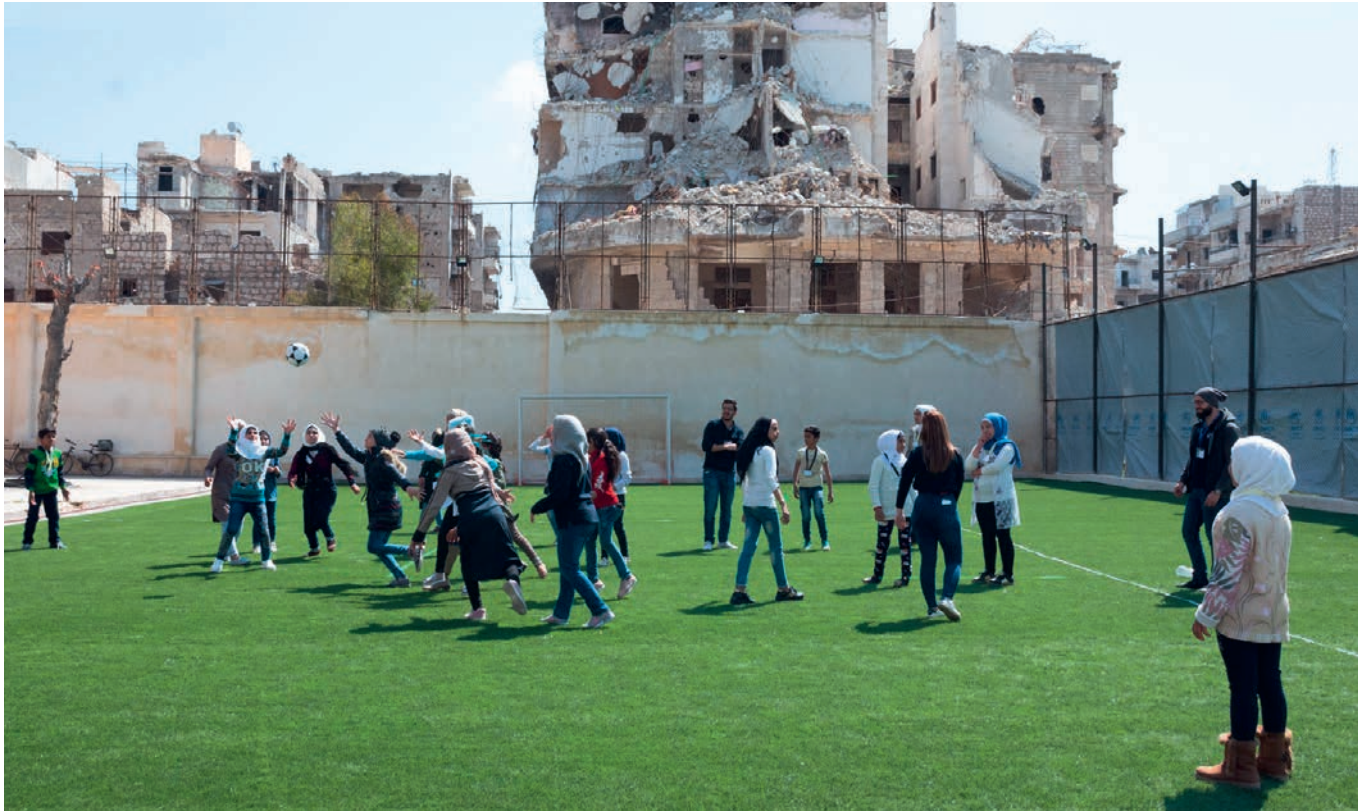
Das Leben zurückgewinnen: Spielnachmittag für Mädchen im Nachbarschaftszentrum des Jesuiten-Flüchtlingsdienstes in Aleppo. Die Stadt im Norden Syriens stand vom Sommer 2012 bis Dezember 2016 unter Belagerung. Weite Teile von Aleppo sind zerstört.