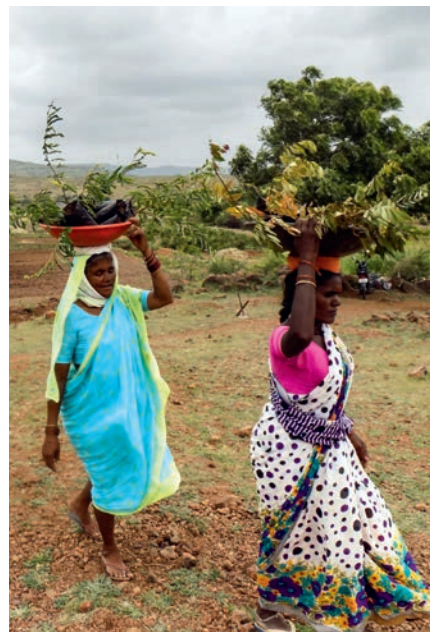
LINKS: Einen Weg zu Gott finden: Jugendliche in Paraguay an der Abschlussfeier ihrer Exerzitientage.