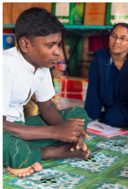
LINKS: Eine Betreuerin und ihre Schützlinge im Zelt der Kinderschutzzone. Schulen sind nicht erlaubt, doch ganz ohne Sprachunterricht geht es nicht: Zugelassen sind Englisch und Burmesisch, nicht aber Bengalisch.