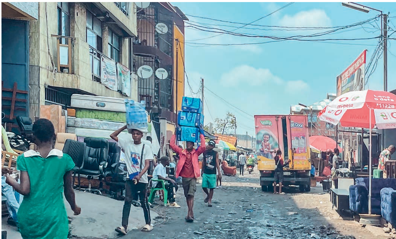
Geschäftiges Treiben in den Strassen von Kinshasa.