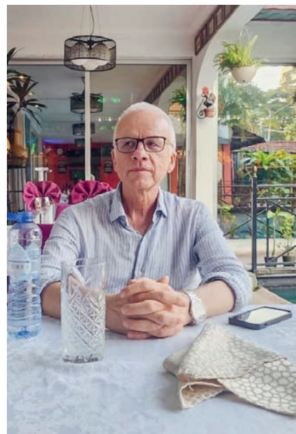
LINKS: Unterwegs zwischen Kinshasa und Kikwit.