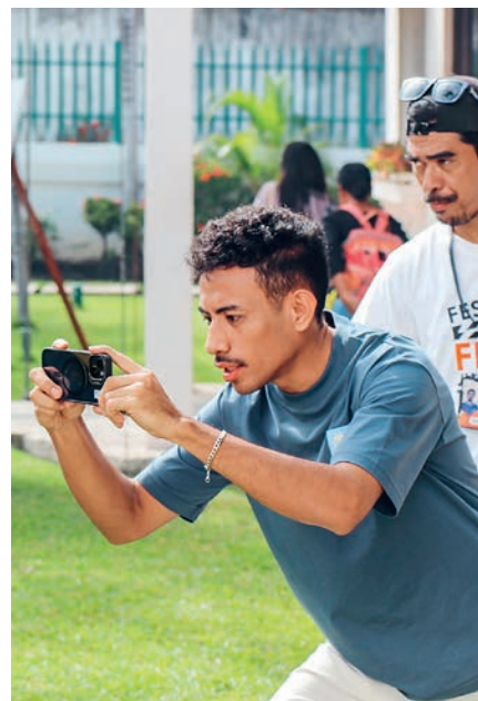
LINKS: CPA zeigt ihre informativen Videos regelmässig in Schulen oder abgelegenen Dörfern ohne Strom.