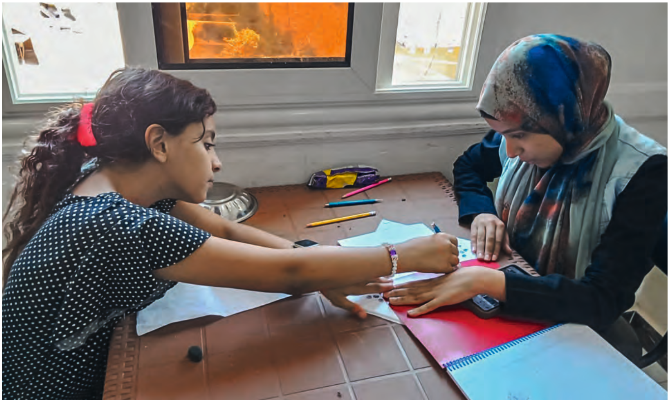
Im Projekt in Minia lernen je ein christliches und muslimisches Mädchen gemeinsam zweimal pro Woche mit einer «grossen Schwester». Bilder S. 8–9: Jesuits & Brothers Association, Minia