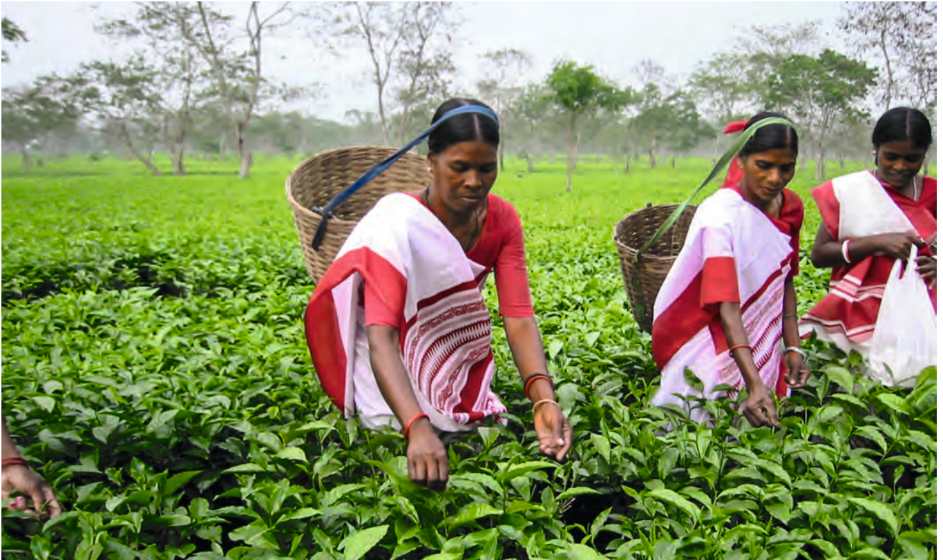
Adivasi-Frauen pflücken Tee. Sie verdienen umgerechnet weniger als drei Franken pro Tag. Soziale Gerechtigkeit in den Teegärten ist eines der Fokusthemen des NESRC.