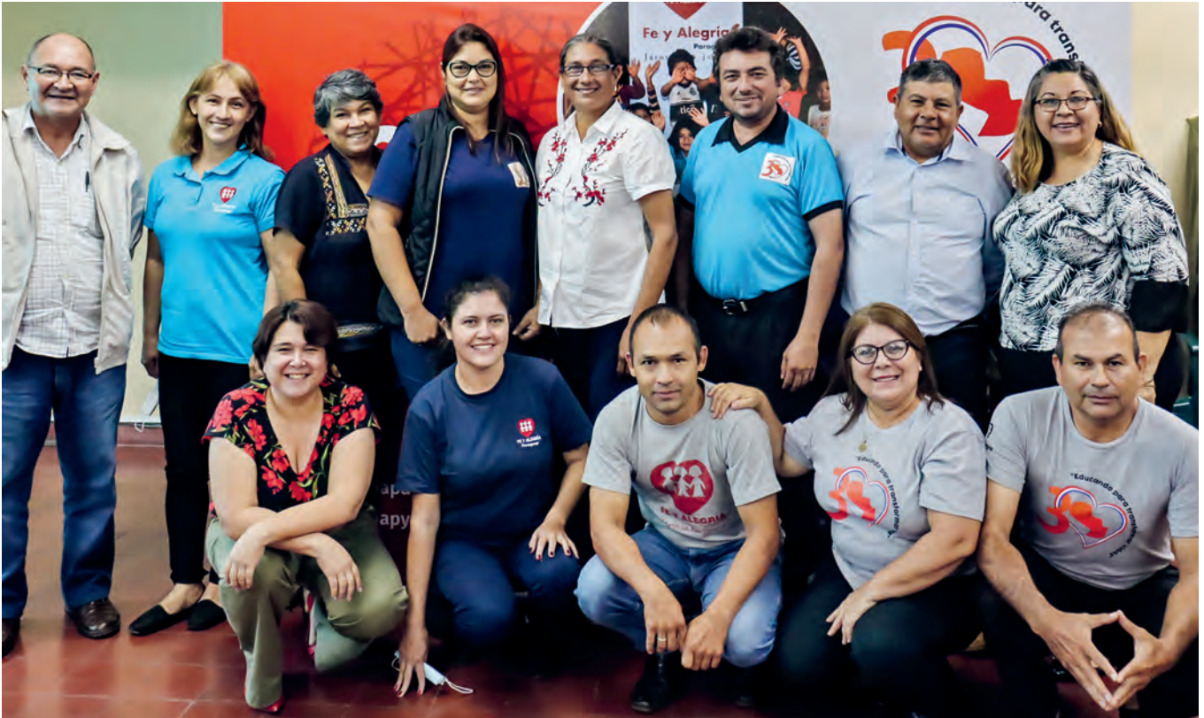
Die Lehrpersonen der Inhaftierten treffen sich dreimal jährlich zum Austausch und zur fachlichen und spirituellen Weiterbildung. Ihre Löhne werden teilweise vom Bildungsministerium übernommen.