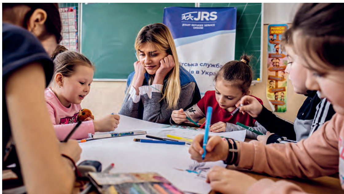
Im JRS-Haus in Lwiw (Lemberg) malen die Kinder gemeinsam ein grosses Plakat. Zeichenunterricht hilft ihnen, sich auszudrücken und das Erlebte zu verarbeiten.