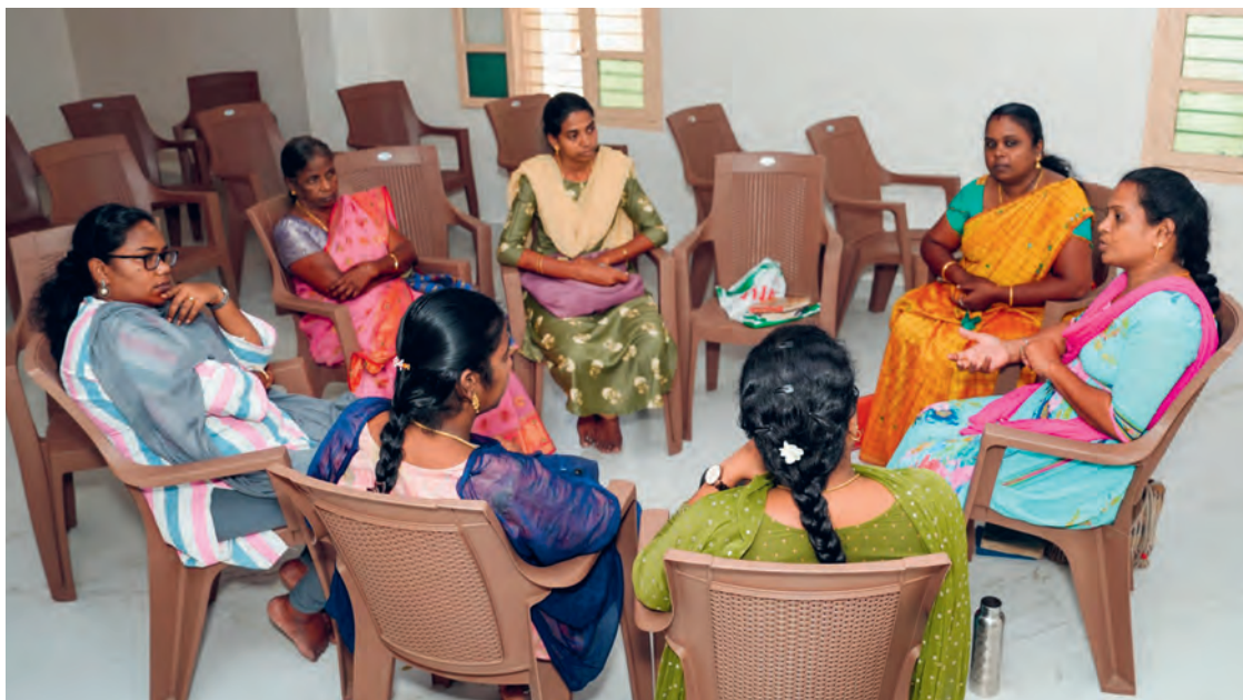
Regelmässige Treffen für Ehefrauen von suchtbetroffenen Männern geben den Frauen Halt. Sie können sich austauschen und unterstützen sich gegenseitig.