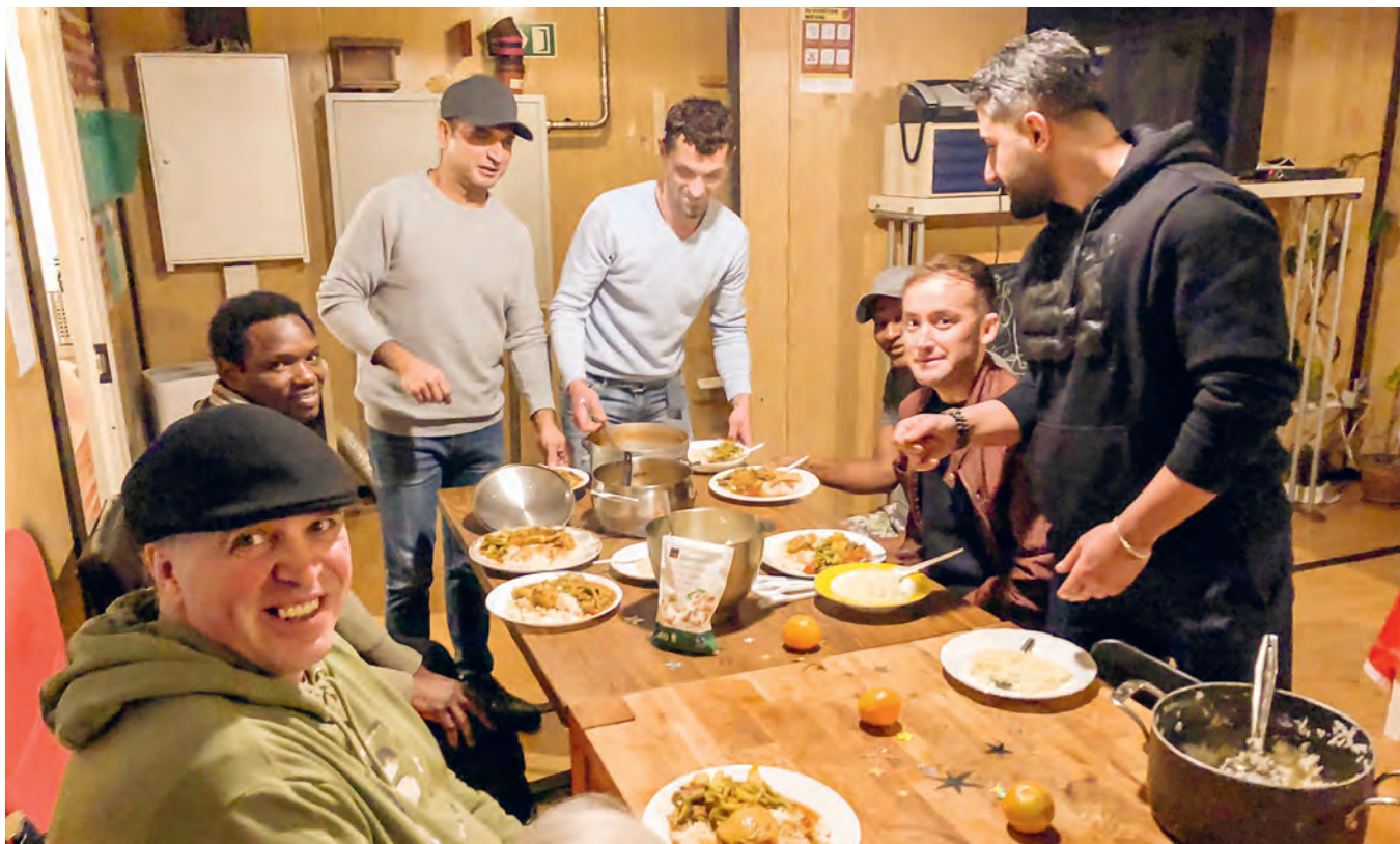
Weihnachtsfeier 2022 im Rückkehrzentrum Glattbrugg