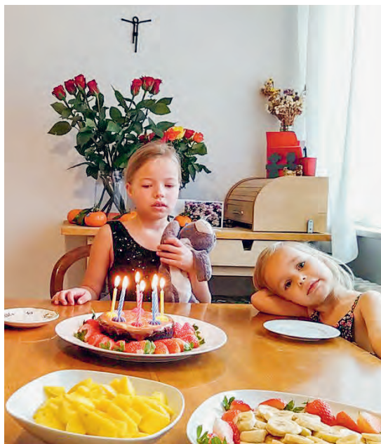
LINKS: Gemeinsames Znacht im Hegner- hof in Kloten.