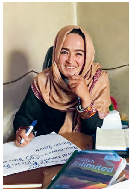
«English Unlimited», so der Titel des Lehrbuches. Im Englischunterricht in diesem Lernzentrum stehen Laptops zur Verfügung. Die Studierenden nutzen auch ihre mobilen Geräte im Präsenzunterricht. Die Studierenden lernen miteinander und unterstützen sich gegenseitig.