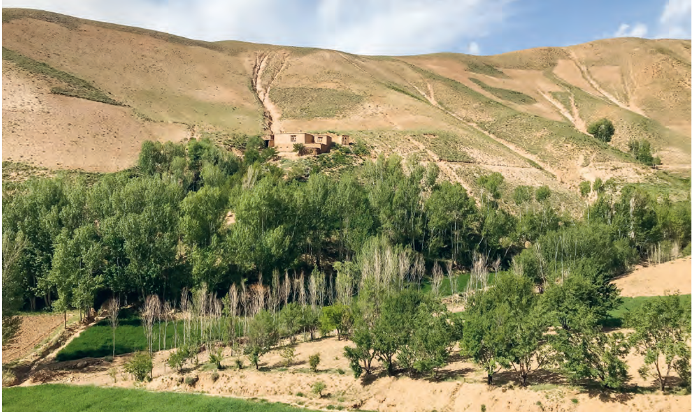
Das Lernzentrum liegt oberhalb eines abgelegenen Dorfes in den Hügeln von Afghanistan und ist eine Oase der Hoffnung. Die jungen Studentinnen und Studenten nehmen lange Wege auf sich, um an den Kursen teilnehmen zu können.