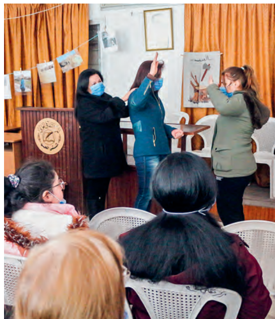
LINKS: Sozialarbeiterinnen und Lehrkräfte werden in psychosozialen Unterstützungsmethoden weitergebildet.