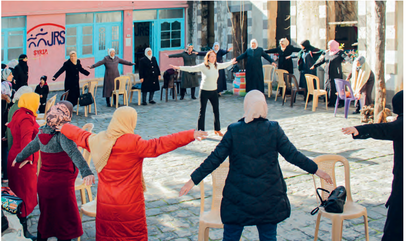
Januar 2022: Im Innenhof des JRS Gemeinschaftszentrums in Homs findet eine Lerneinheit des Community Building Workshop für Frauen statt.