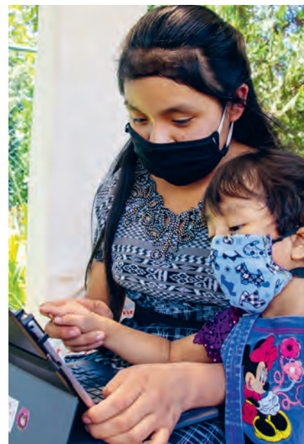
LINKS: Dank vielen Freiwilligen konnte schnell gehandelt werden. Im Bild ein Vorbereitungstraining der Provinz Karnataka, Indien. RECHTS: Fe y Alegría bietet Radiounterricht und Online-Material in Guatemala an. Die kleine Schwester ist zu Hause auch dabei.