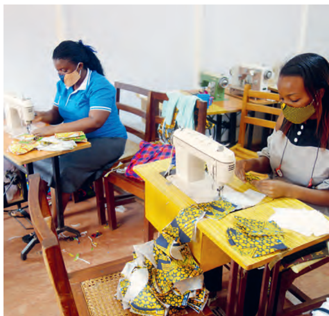
LINKS: Flüchtlingsfamilien in Uganda erhielten Essenspakete. Diese sichern das Überleben.