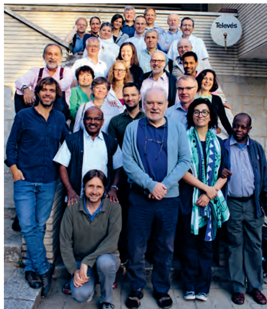
LINKS: Jesuit Refugee Service (JRS) Zentralafrikanische Republik: Bildungsprogramm für Katecheten in der Gemeinde nach der Heimkehr aus dem Flüchtlingslager. RECHTS: Koordinationstreffen der 13 Organisationen des Xavier Network in El Escorial, Spanien, Ende September 2017.