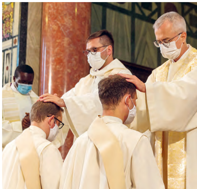
LINKS: Christus Salvator von Georg Petel (1632), Moritzkirche Augsburg.