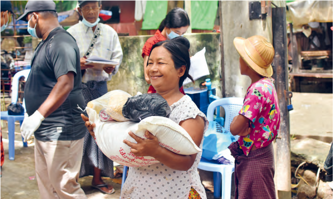
Die Jesuiten reagierten weltweit sehr schnell auf die Covid-19-Pandemie und verteilten Essenspakete und Hygienekits. Eine Empfängerin in Yangon, Myanmar, freut sich über diese Soforthilfe.