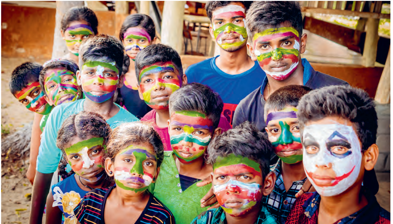
Mit Kunst, Musik, Tanz und Sport werden die Talente der Rainbow Kids gefördert.

hen. Gegenwärtig konzentrieren wir uns auf die Befähigung der Frauen und die Ausbildung der Kinder.