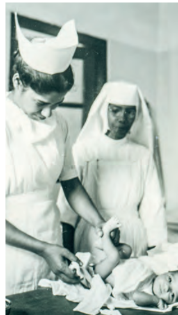
LINKS: Missionare waren auch Pioniere im Aufbau von Gemeinden und Infrastruktur.