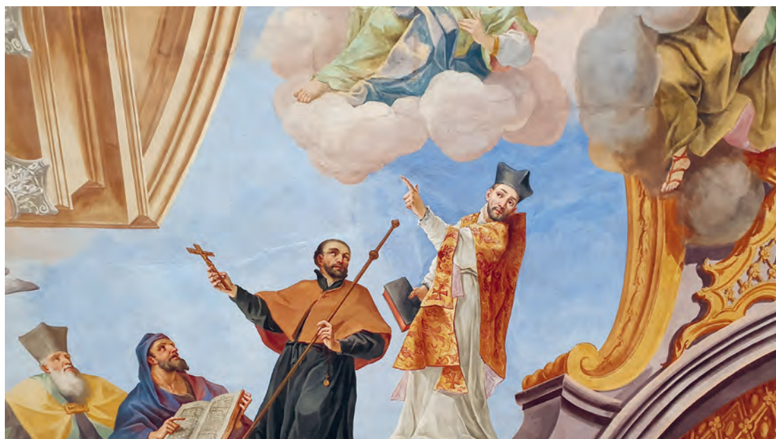
Deckengemälde im ehemaligen Jesuitenkolleg Dillingen: Das Deckenfresko im Bibliothekssaal (Ausschnitt) zeigt Ignatius von Loyola (im Priestergewand) und Franz-Xaver (mit dem Kreuz in der Hand). Beide wurden 1622 heilig gesprochen.