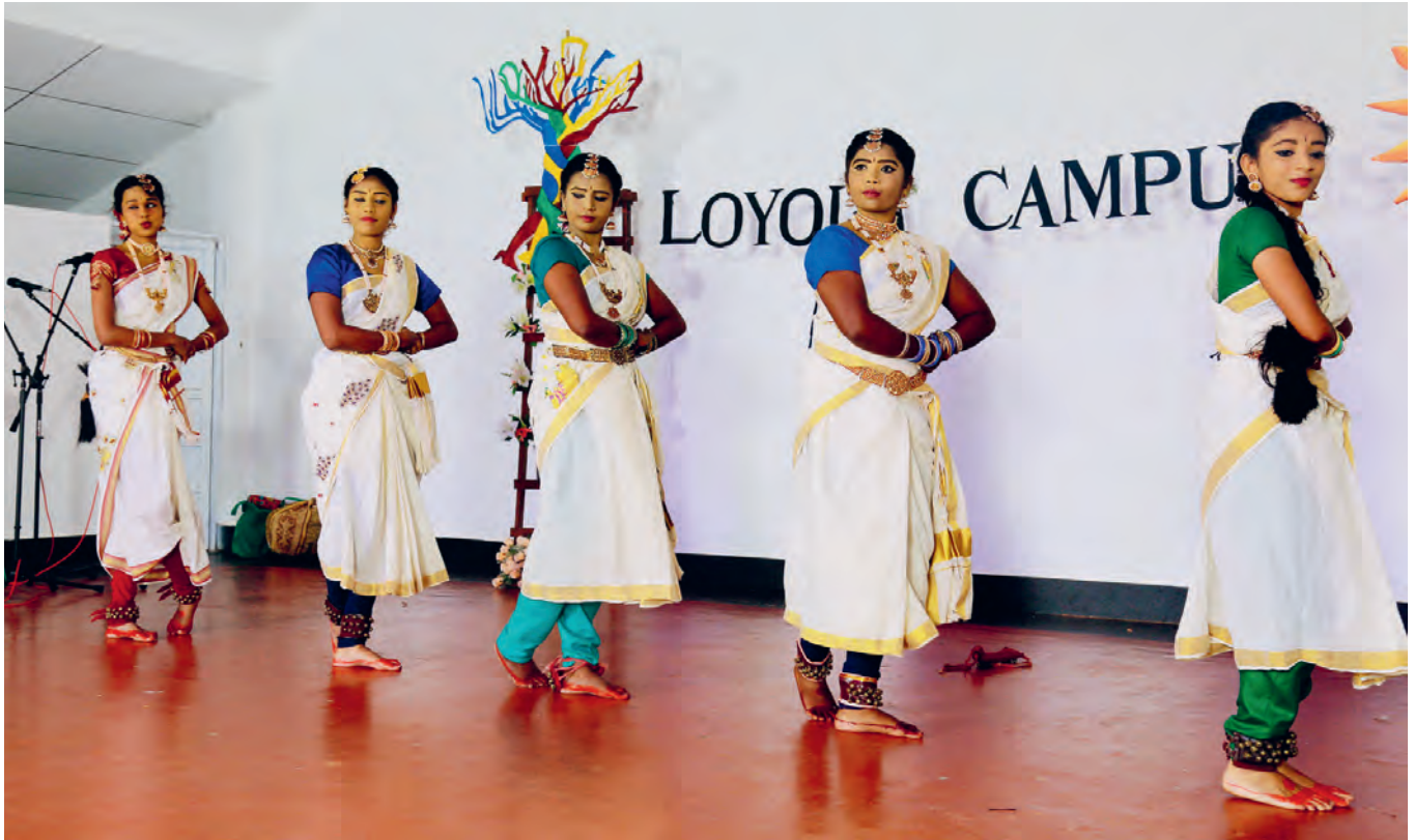
Feier zum Schulabschluss am Loyola Campus in Mullaitivu. Ein Zentrum für höhere Bildung entsteht. Es hat die Vision eines versöhnten Sri Lanka.