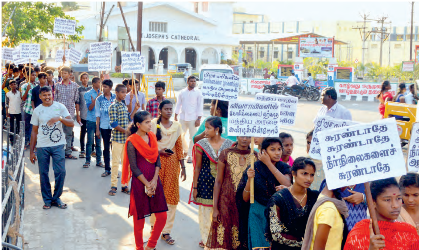
Studentinnen und Studenten setzen sich dafür ein, dass die Wasserressourcen in ihrer Heimat geschützt werden. Dieses zivilgesellschaftliche Engagement hat seinen Anfang in Motivationstrainings, die das DHRC für Schülerinnen und Schüler durchführt.