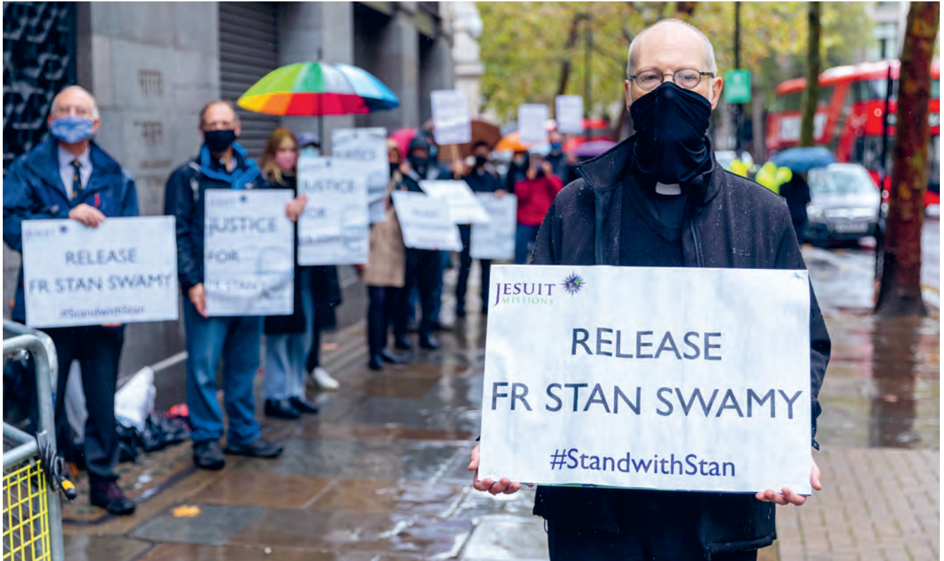
#StandwithStan – weltweite Solidarität mit Pater Stan Swamy: Am 10. Dezember 2020, dem Tag der Menschenrechte, protestieren in London britische Jesuiten zusammen mit ihrem Freundeskreis vor der High Commission of India in London.