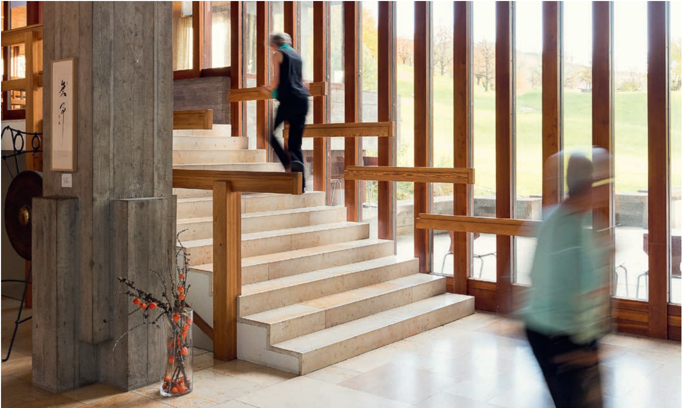
Das Lassalle-Haus, Hort von Hoffnung, ist weiterhin offen, die Rote Kapelle ebenso: Um niemanden abzuweisen und die Schutzmassnahmen einzuhalten, finden sonntags manchmal mehrere Gottesdienste statt.