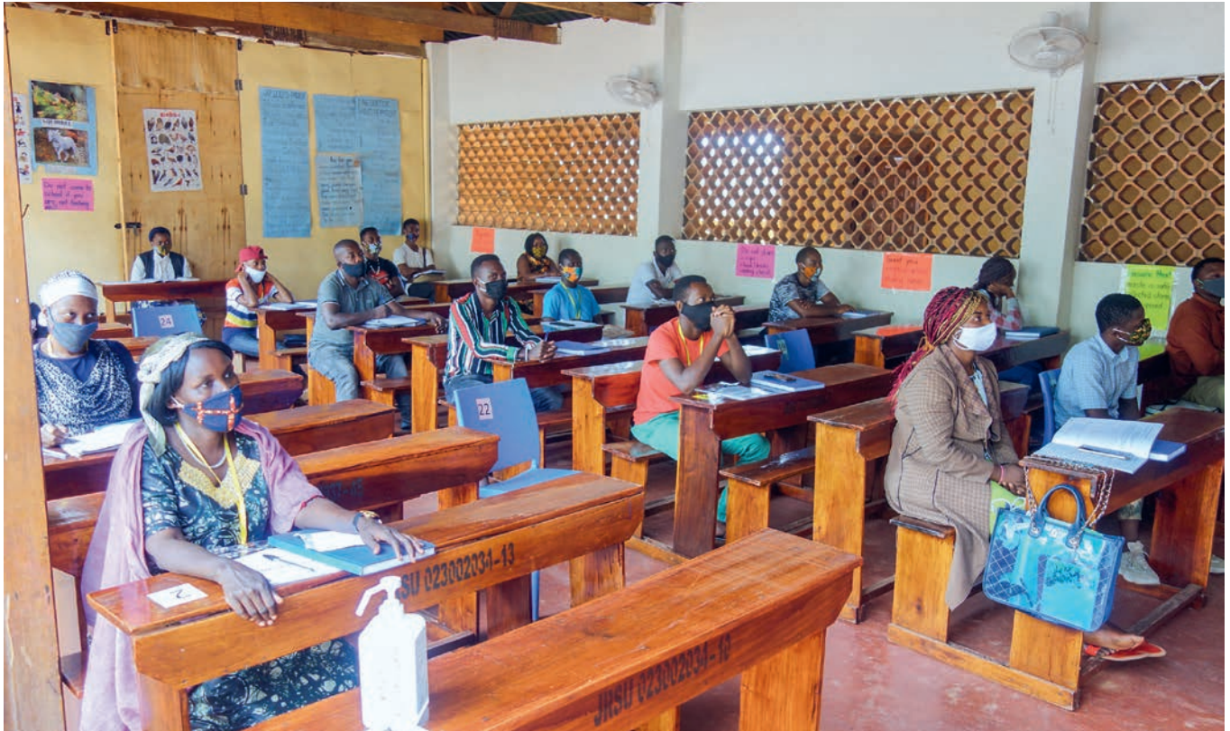
Am 15. Oktober 2020 haben nach über sechs Monaten die Englischklassen in Kampala wieder die Türen geöffnet. Mit Gesichtsmasken, Desinfektionsmittel und Einhaltung des Sicherheitsabstands findet nun endlich der Unterricht wieder statt.