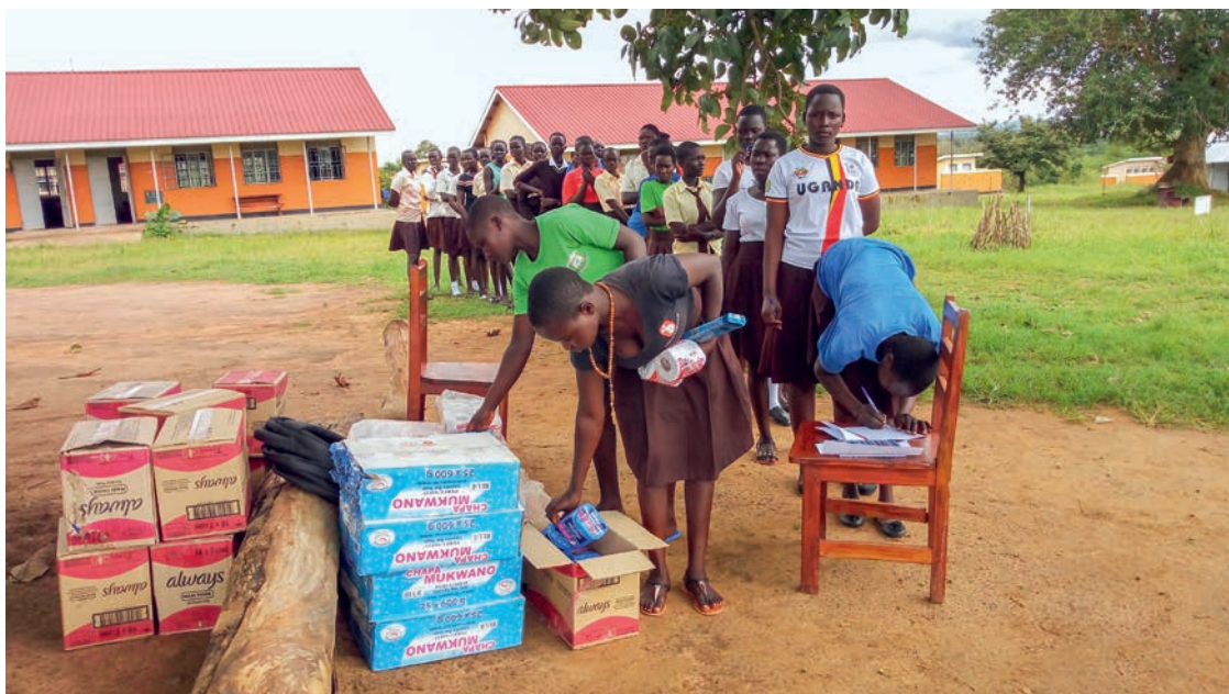
Besonders notwendig ist die Unterstützung der Mädchen in Norduganda mit Schulgeld, Schuluniform, Büchern, Schreibmaterial und Hygieneartikeln. Hier verteilt der JRS in einer der 21 Partnerschulen Seife, Toilettenpapier und Hygieneartikel an die Mädchen.