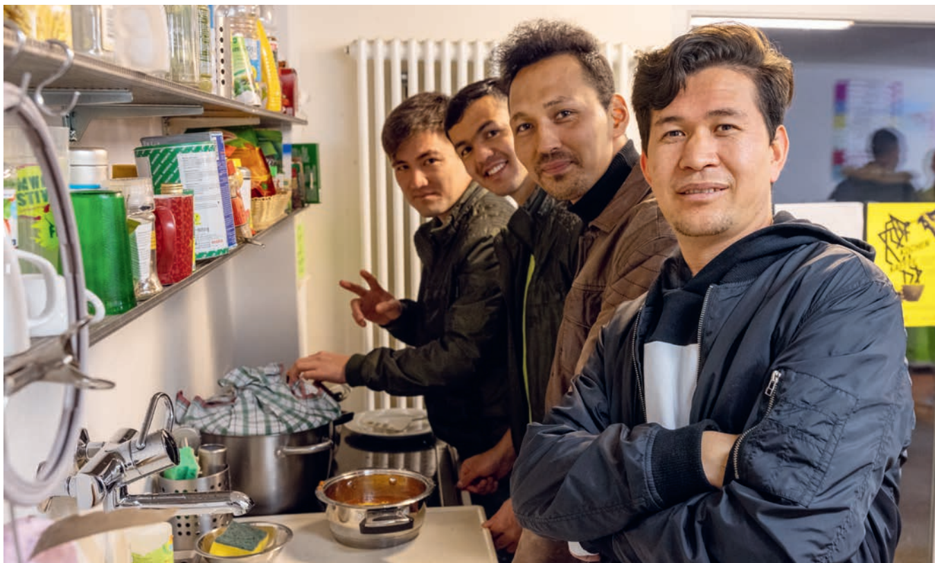
Seit 2017 treffen sich Nothilfetroffene jeden Dienstag zum gemeinsamen Kochen und Abendessen, begleitet durch die von Christoph Albrecht koordinierte Besuchsgruppe in Kloten. Der Anlass ist offen für alle, auch Einheimische.