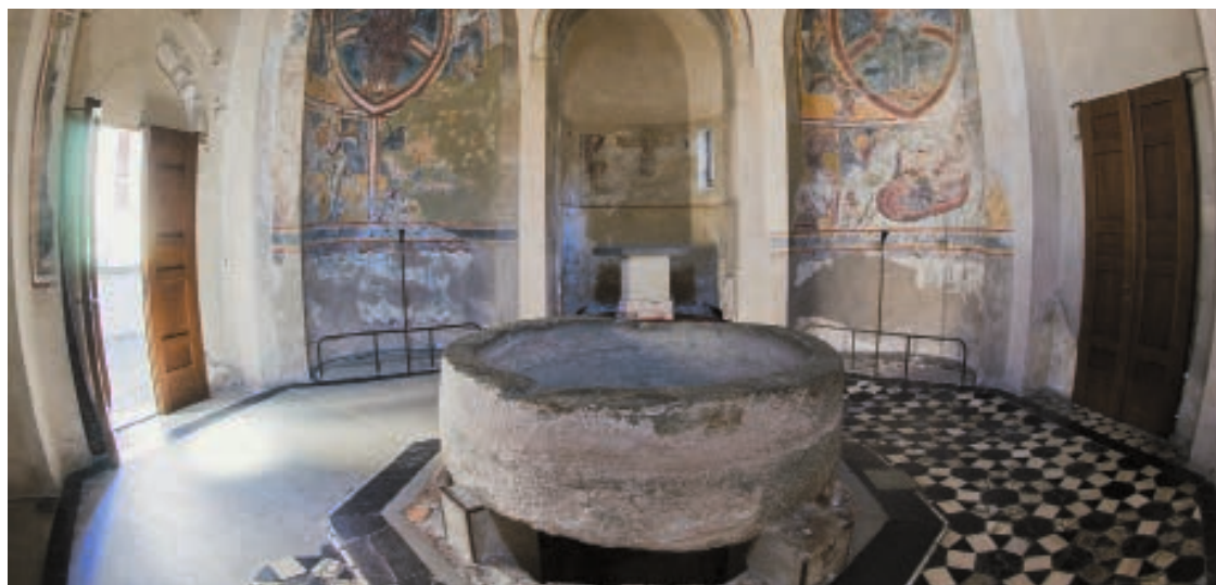
Baptisterium San Giovanni in Riva San Vitale TI: Hier fanden ab dem 5. Jahrhundert Tauffeiern statt. Es ist das älteste christliche Bauwerk der Schweiz und liegt mitten im Dorf am südlichen Ende des Luganersees.

Das Motto des Oktobers lautet «getauft und gesandt». Entdecken wir das Getauftsein neu, als Zeichen des anbrechenden Reich Gottes. Engagieren wir uns als Christen für Schutzlose, Alleingelassene. Andere ernst zu nehmen, sensibilisiert – auch für den Raubbau an der Schöpfung. Theologisch-christlich gesehen, gibt es keine egoistische Teilhabe am Reich Gottes. Ist Engagement echt, gewährt sie dem Nächsten und der Schöpfung Raum, Aufmerksamkeit, Entfaltung. Toni Kurmann SJ