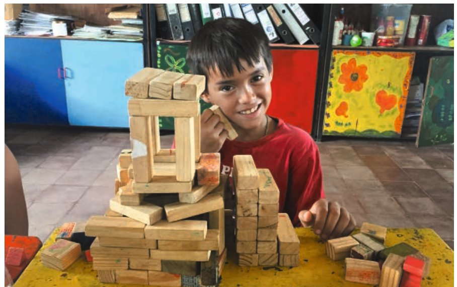
Caazapa/Paraguay: Glückliche Stunden in der Kinderbetreuung, während seine Eltern am Programm für ökologische Produktion und Distribution von Mate-Tee teilnehmen.

** www.jesuiten.ch/solidaritaet/der-missbrauch-und-seine-wurzeln-lesen-sie-dazu-p-klaus-mertes-sj-kompetentes-interview.html