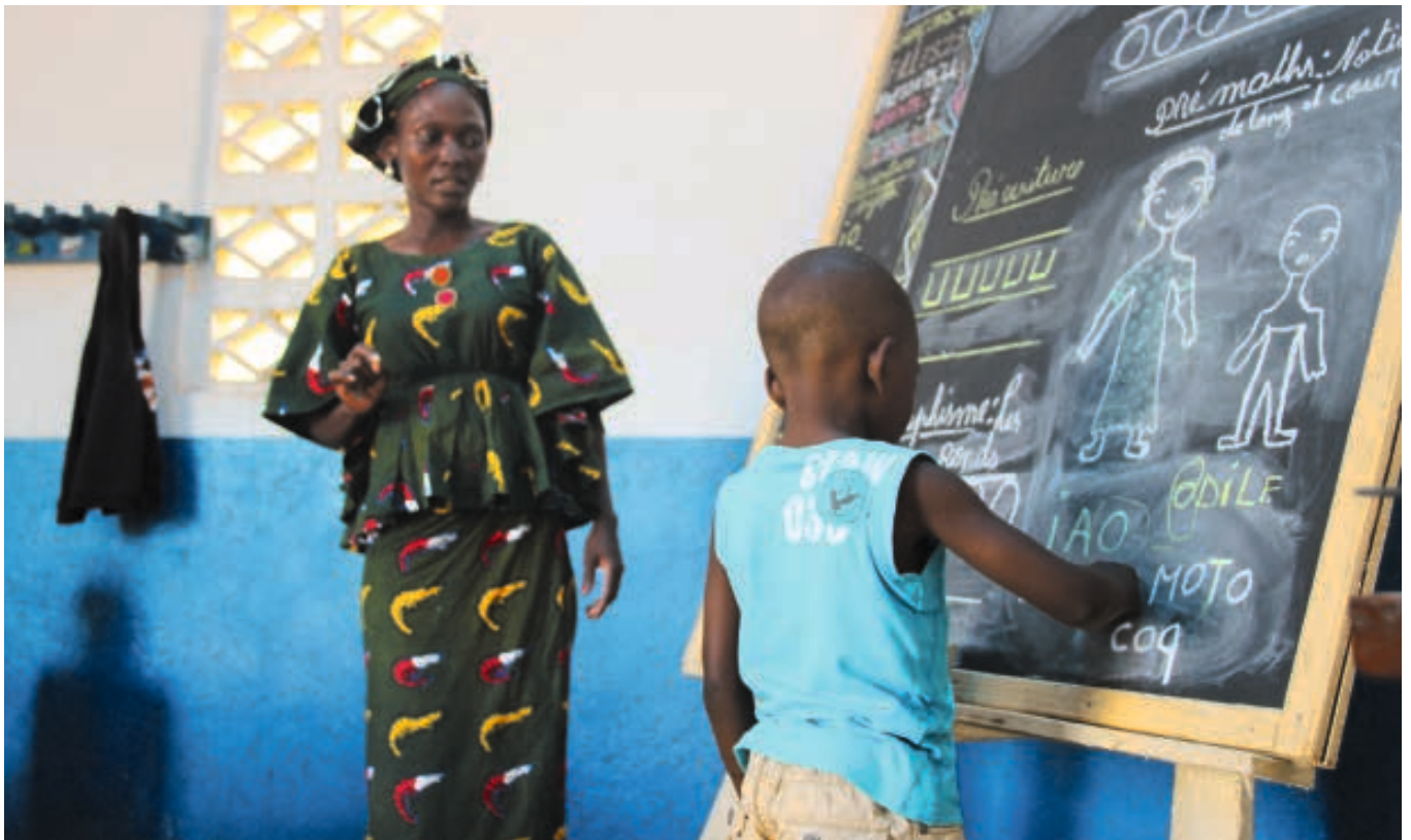
JRS-Kindergarten in Bangui/ Zentralafrikanische Republik. Die Lehrerin bringt ihrem talentierten Schützling erste Buchstaben bei. Das Titelbild mit den vielen Schulkindern stammt vom gleichen Ort: Mathematikunterricht in der JRS-Primarschule von Bangui.