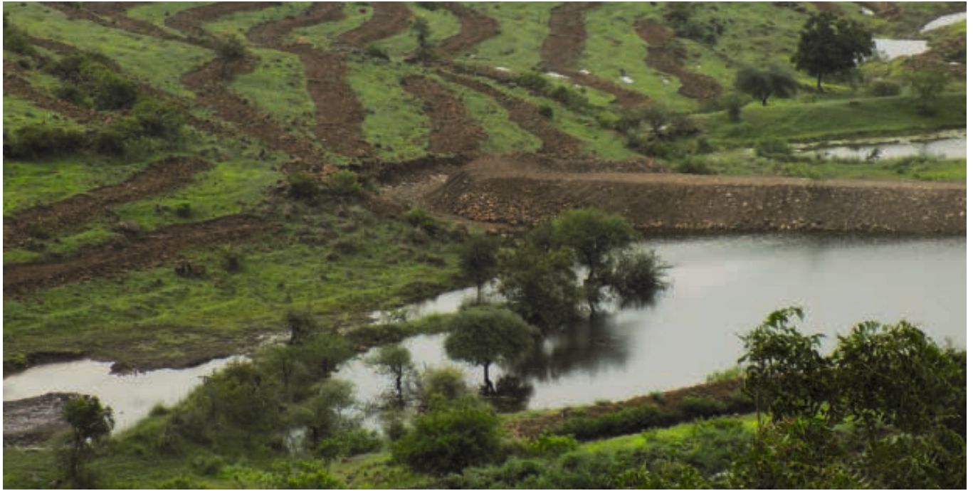
Drei Jahre nach Projektstart in Karanji hat sich der Grundwasserspiegel erhöht und versickert das gesammelte Wasser nicht gleich wieder. Die Gemeinde kam ohne Tankwasserlieferung durch den Sommer und konnte das Wasser gar mit Nachbardörfern teilen.