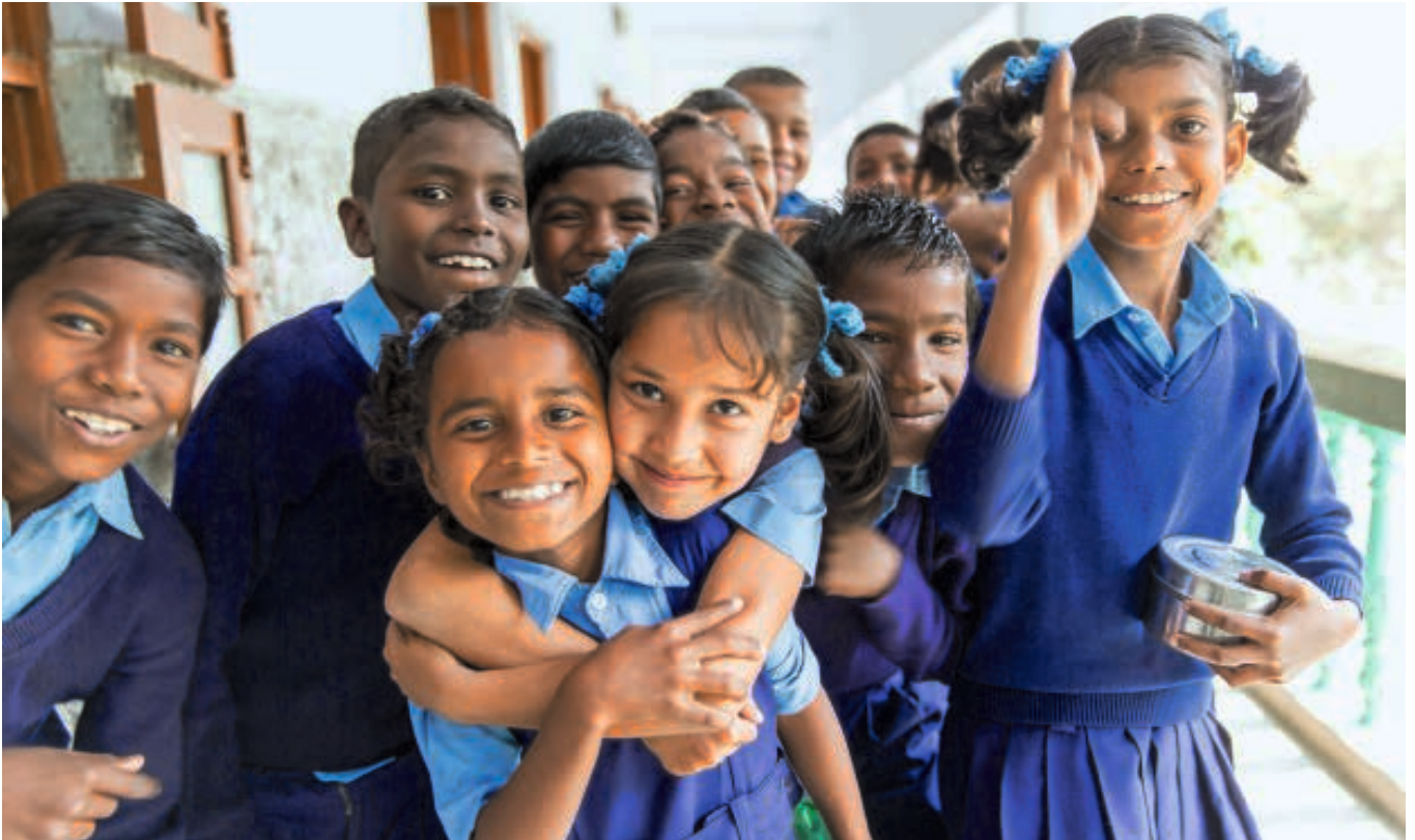
Uttar Salbai/Darjeeling Indien: Mädchen und Buben an der Loyola High School für Kinder von marginalisierten Tribal-Familien sowie von Teeplantagen-Arbeiterinnen und -Arbeitern. Die Schule hat Platz für 1200 Kinder und führt bis zum 12. Schuljahr.