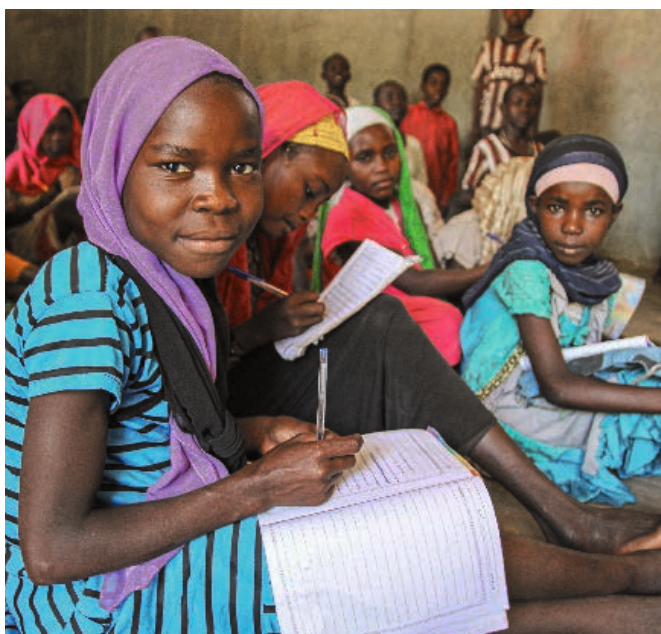
RECHTS: JRS-Berufszentrum Bertoua/Kamerun. Das Flüchtlingsmädchen aus der Zentralafrikanischen Republik macht eine elektro-mechanische Anlehre.