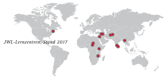
JWL-Lernzentren, Stand 2017

Ansehen von Religion, Kultur, Hautfarbe oder Geschlecht. Seit 2010 konnten bereits 5 000 junge Männer und Frauen aus 40 Ländern ausgebildet werden. Aktuell sind 2 800 Studierenden registriert, darunter 600, die vom «Centre for Child Protection» an der Päpstlichen Universität Gregoriana in Rom betreut werden.