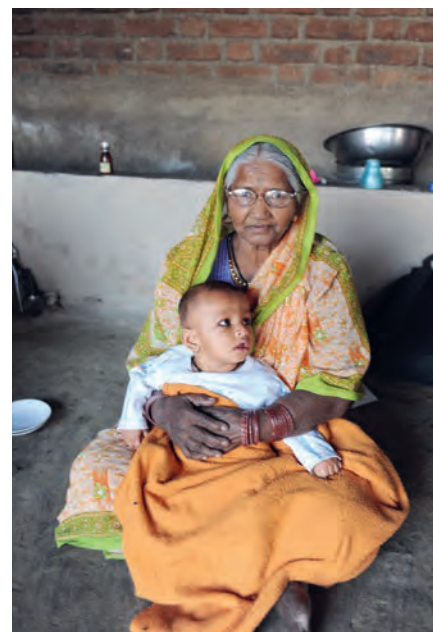
LINKS: Die Männer haben gelernt, wie man einen Baum am besten pflanzt – mit reichlich Biomasse.