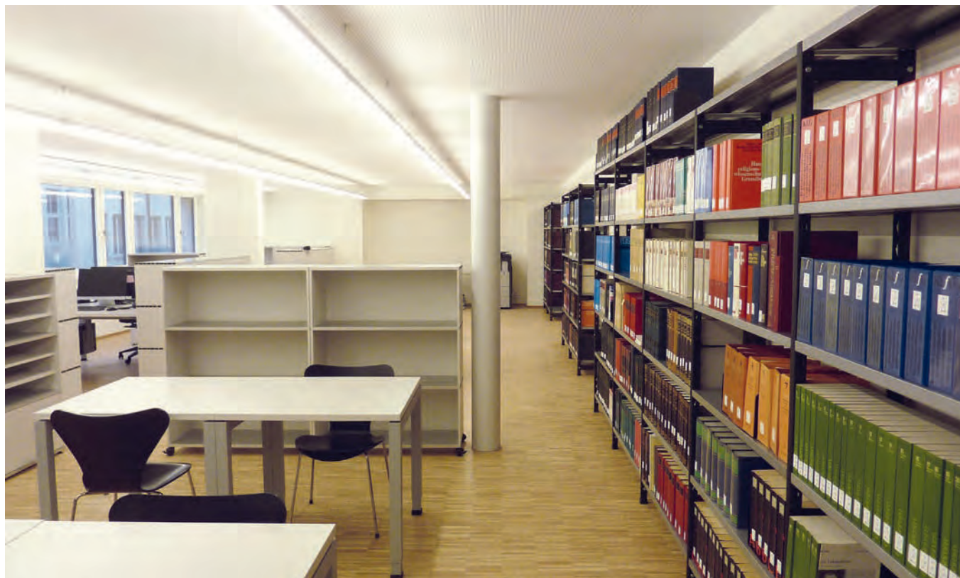
Am 1. März 2018 wird die «Jesuitenbibliothek Zürich» mit dem Archiv der Schweizer Jesuitenprovinz in den neuen Räumlichkeiten in Zürich offiziell eröffnet. Die Bibliothek ist angeschlossen an den Schweizer NEBIS-Verbund und steht allen Interessierten offen.