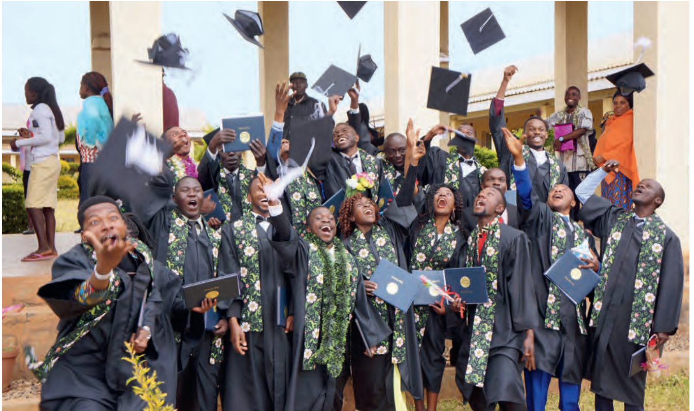
Geschafft: Studierende in aller Welt feiern ihren Abschlusstag ganz gross. So auch die jungen Frauen und Männer, die über die Organisation «Jesuit Worldwide Learning» im Flüchtlingslager Dzaleka in Malawi ein Studium abgeschlossen haben.