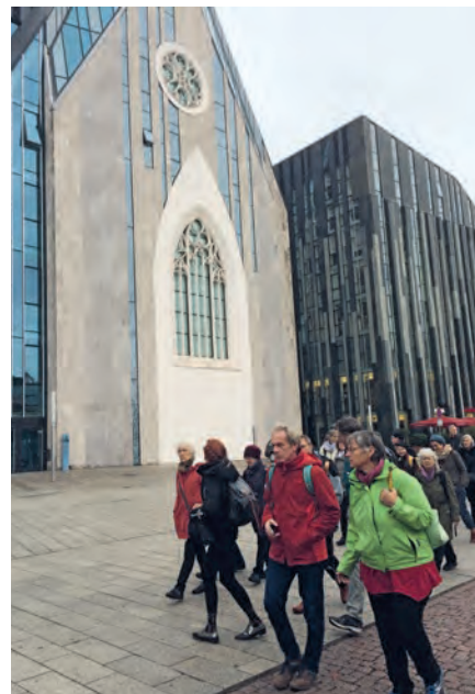
LINKS: Führung in der St. Petri-Pauli-Kirche in Martin Luthers Geburtsort Eisleben