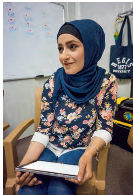
LINKS: das JWL-Lernzentrum im Flüchtlingslager Khanke, im Nordirak