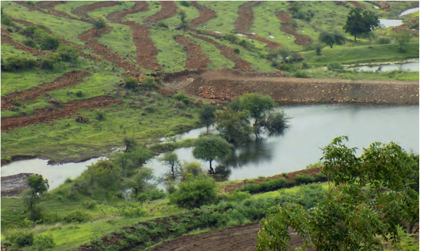
Hier bremsen Konturgräben (oben) entlang der Topografie des Geländes das Regenwasser und verhindern, dass es zu schnell versickert. So dringt die Feuchtigkeit auch in tiefere Bodenschichten ein. In Mulden bzw. «Absorptionsgräben» lässt sich das Wasser auffangen.