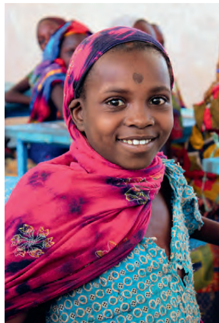
Die Bevölkerung im Tschad ist jung, mehr als 54 Prozent sind unter 20 Jahre alt. Bildung, ob in Schulen oder im Zusammenhang mit praktischer Berufstätigkeit, ist ein Muss für eine bessere Zukunft. Allerdings haben es Mädchen traditionell besonders schwer, eine gute Ausbildung zu erhalten.