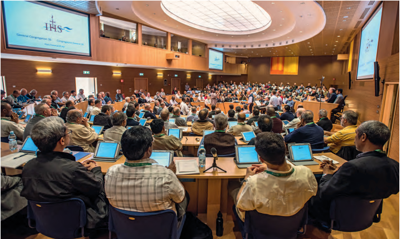
Multimedial aufgestellt: die Generalkongregation der Jesuiten in Rom beim täglichen Morgengebet mit Musikbegleitung