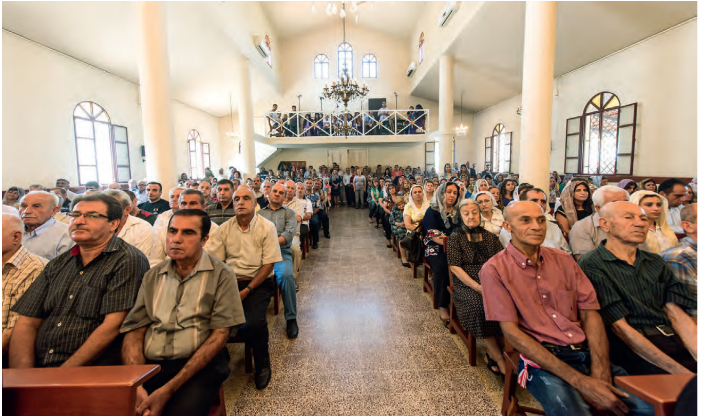
Gut besucht: der assyrisch-orthodoxe Gottesdienst in der Saint George Assyrian Church in Beirut im Libanon. Die Gemeinde besteht heute mehrheitlich aus syrischen und irakischen Flüchtlingen (Foto von 2016).