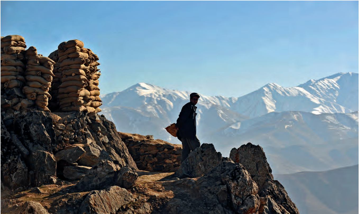
Atemberaubende Landschaft, ungewisse Zukunft: im Norden Afghanistans in der Nähe der Provinzhauptstadt Faizabad