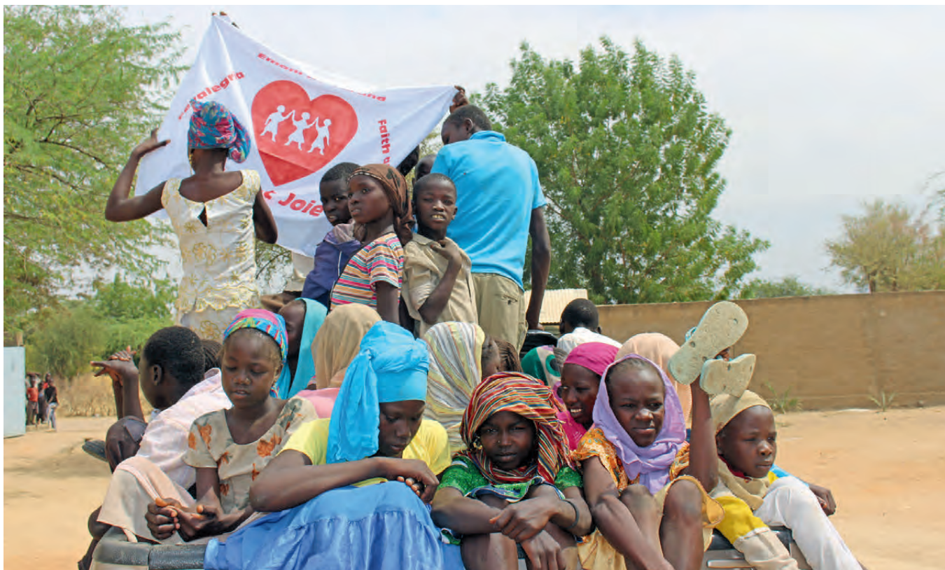
Jugendliche im Tschad unter der Flagge des Schulwerks Fe y Alegría – rotes Herz auf weissem Grund