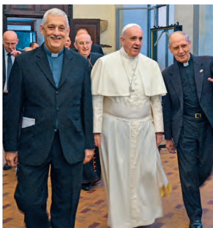
Papst Franziskus mit dem neuen Generaloberen Pater Sosa (l.) und Pater Nicolás.

Die Zusammensetzung der Generalkongregation spiegelte die weltweite Prä-